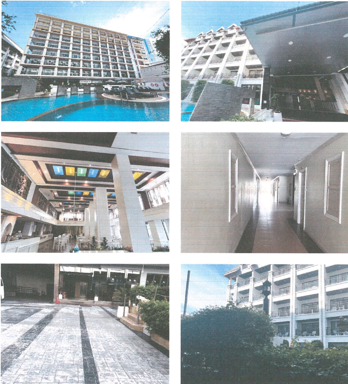
รูปภาพที่ 1.3 การใช้พื้นที่ของโครงการ